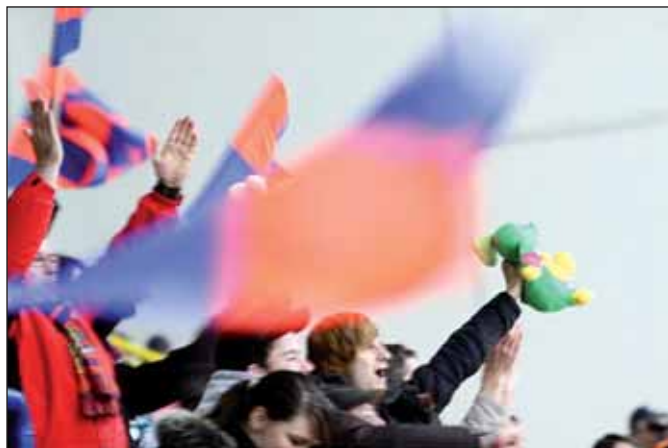
Při prvním gólu zasypali diváci ledovou plochu plyšovými hračkami.