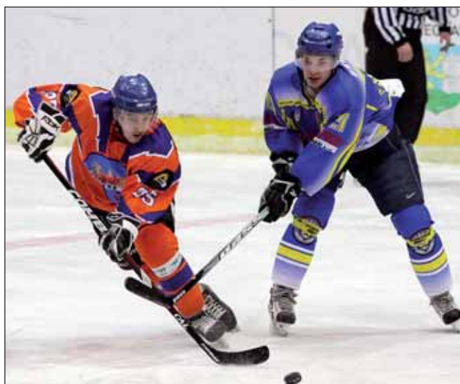
Oslabená Břeclav sice vyrovnala, náporu Drtičů ale nakonec podlehla.