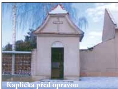
Kaplička před opravou