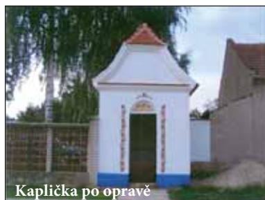
Kaplička po opravě

chala v Ladané vyhrála v soutěži „Nejlépe opravená kulturní památka Jihomoravského kraje v roce 2009 a kapli sv. Kříže v Koticích jsme nominovali do této soutěže letos. Výsled-