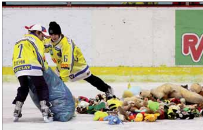
Na kluziště dopadlo neuvěřitelných 1500 plyšáků.